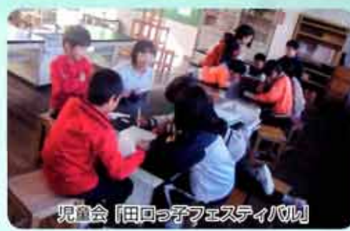
児童会「田口っ子フェスティバル」