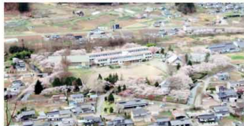
位置 標高 724m 東経 138° 30' 北緯 35° 11'